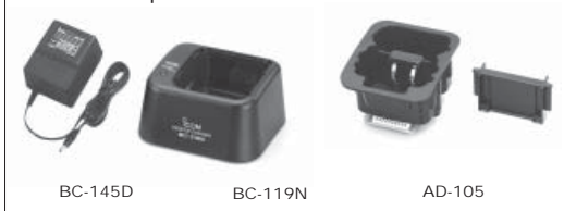
BC-119N Chargeur + BC-145D Alimentation + AD-105 Adaptateur

Chargeur rapide Ni-Cd pour la charge des batteries BP-202 seule ou avec le portatif. Temps de charge: 75 à 85 min.