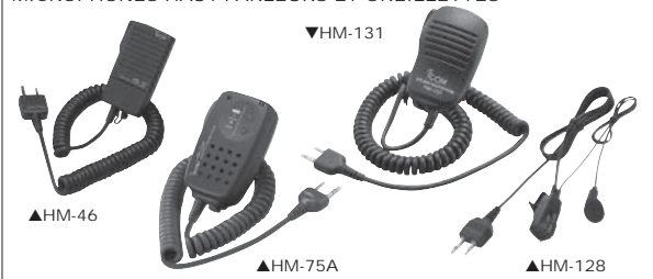
MICROPHONES HAUT-PARLEURS ET OREILLETES

BC-10N : Chargeur rapide 2 postes livré avec alimentation 220 V et câble allume cigare BC-121N : Multi-chargeur rapide (à utiliser avec 6 AD-105 et 1 BC-157) BC-157 : Alimentation pour BC-121N EP-OT1FB : Oreillette discrète EP-OT2FN : Ecoute discrète mic/PTT déporté EP-OT3FN : Ecoute discrète mic et PTT déporté EP-SAT01 : Micro oreillette haute résistance EP-SHC300S : Oreillette avec tour d'oreille HM-46 : Microphone haut-parleur miniature