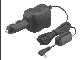
CP-18E Câble allume cigare

6 V, 2 A à partir du 12 V (avec convertisseur international DC-DC).