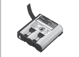
BP-202 Batteries Ni-Cd

Batterie à installer dans le portatif. 3,6 V / 700 mAh